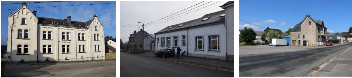
Les trois derniers projets en cours ou en attente du PCDR 2010-2020